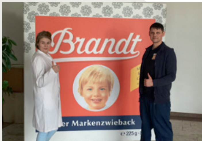
Motivierte Teilnehmende bei der AlphaGrund-Schulung für Brandt Zwieback

Mitte Februar 2018 startete die Schulung im Unternehmen. Inhaltlich ging es zunächst um fachspezifische Anleitungen, wie zum Beispiel Hygienevorschriften und Belehrungen. Im späteren Kursverlauf wurden Verfahrensweisungen direkt am Arbeitsplatz mit den Beschäftigten