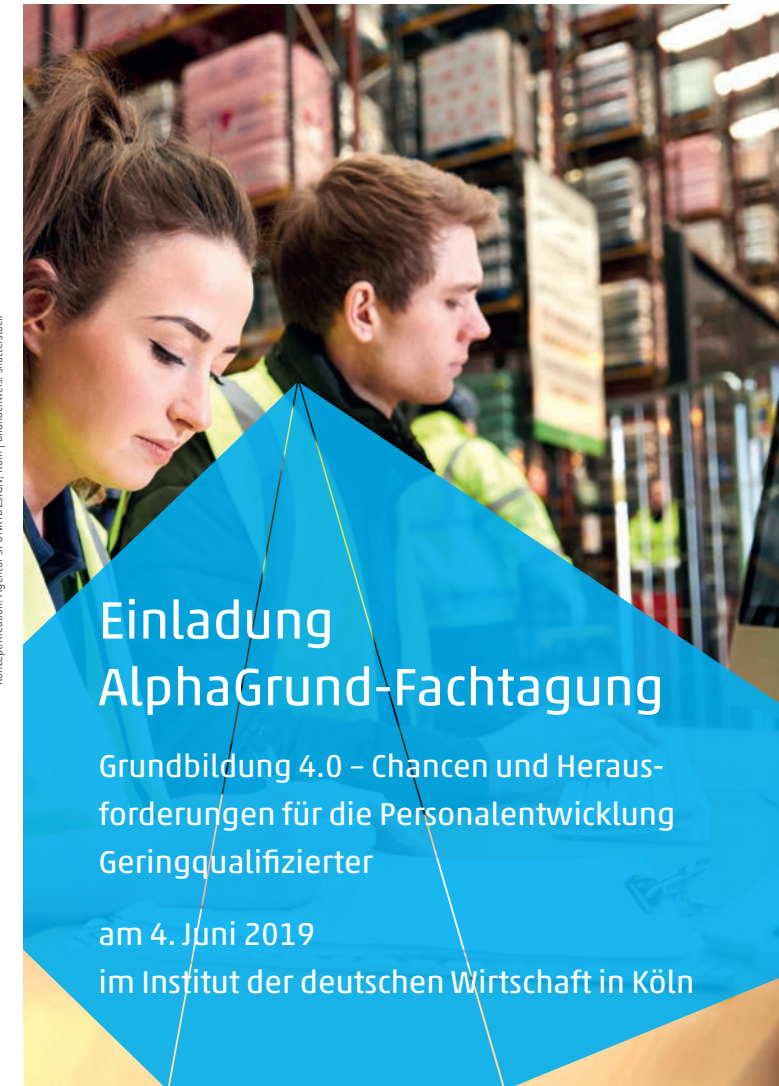
Konzept/Kreation: Agentur 3PUNKTDESIGN, Köln | Bildnachweis: shutterstock