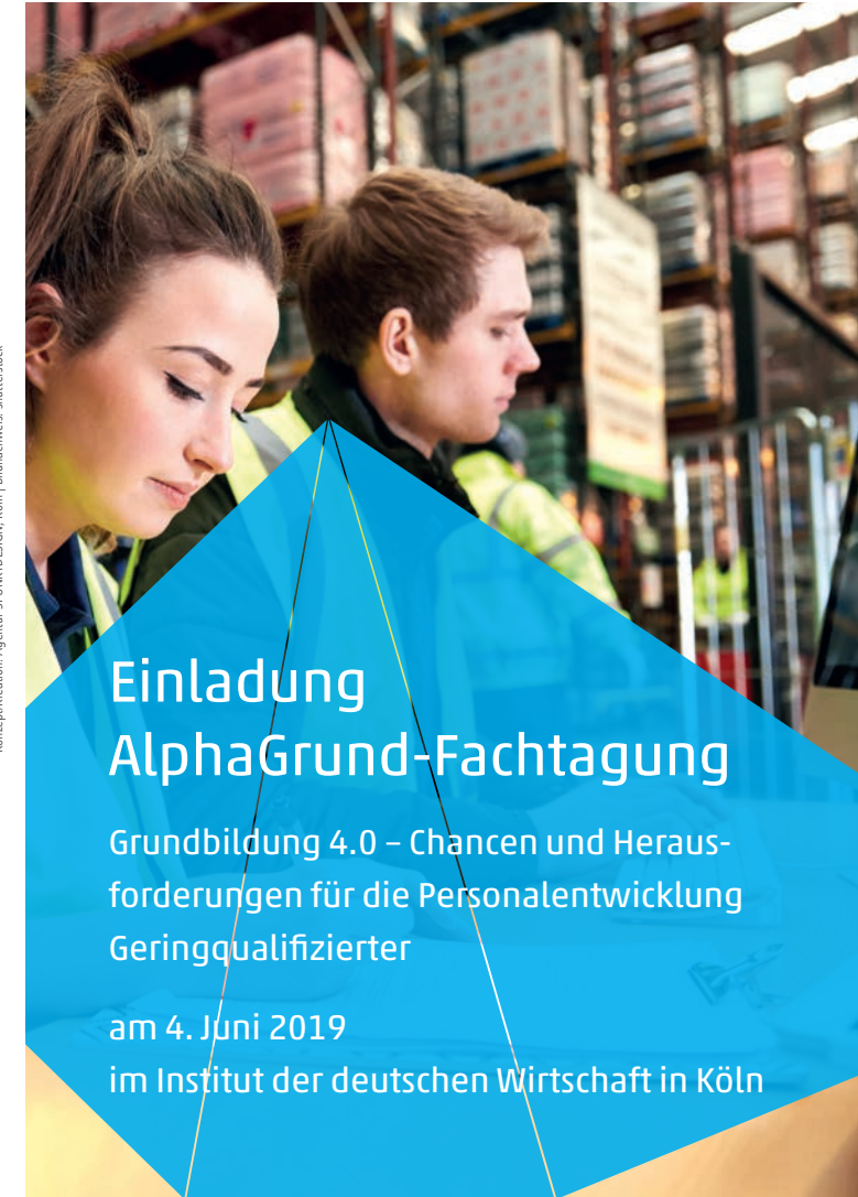
Konzept/Kreation: Agentur 3PUNKTDESIGN, Köln | Bildnachweis: shutterstock